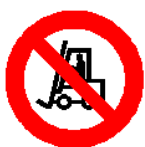
Vietato ai carrelli di movimentazione