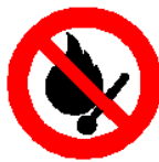
Vietato fumare o usare fiamme libere