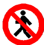
Vietato ai pedoni