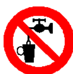
Acqua non potabile