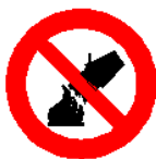
Divieto di spegnere con acqua