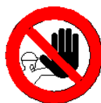
Divieto di accesso alle persone non autorizzate