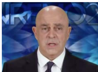
MAURIZIO CROZZA Festival di Sanremo 2017