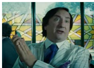
ANTONIO ALBANESE Qualunque 2011