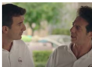
FICARRA E PICONE L'ora legale 2017