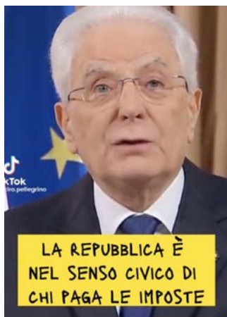
SERGIO MATTARELLA Il Presidente della Repubblica Italiana